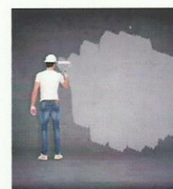
Krystaline 1 Krystaline 2

Mortero de reparación impermeabilizante para las grietas y juntas restantes